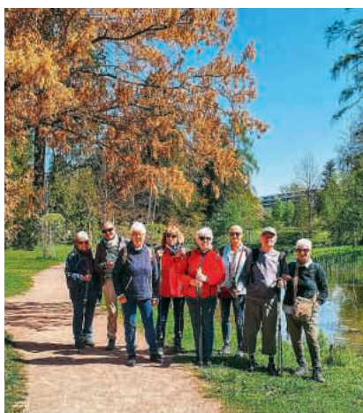
In der Bally-Parkanlage