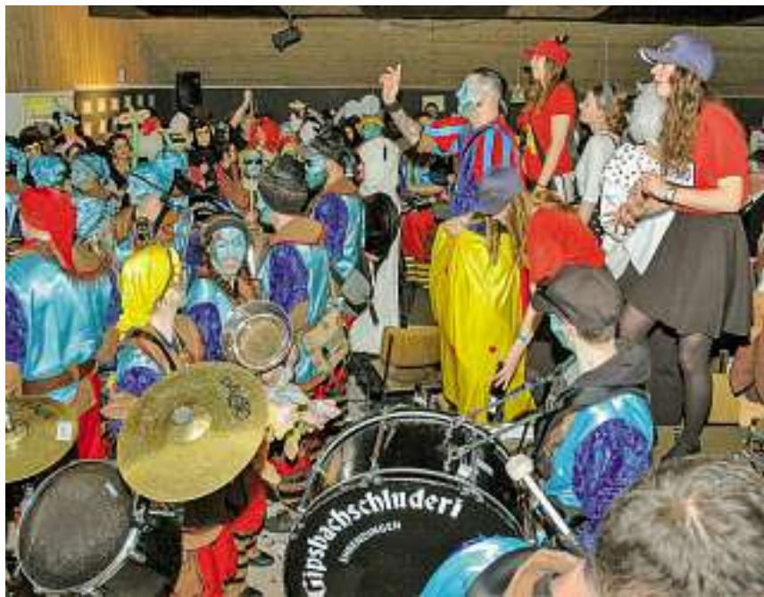
Volles Haus beim «Film ab!» in Unterendingen