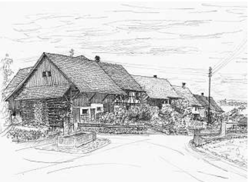
Dorfstrasse und Dorfbrunnen, gezeichnet von Karl Albiez (um 1990)