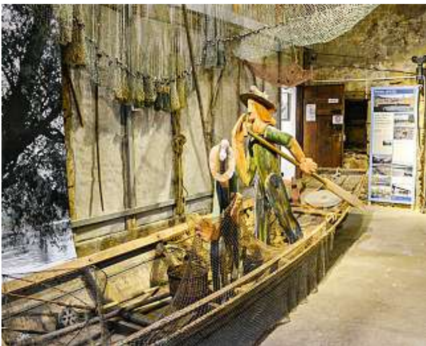
Weidling in der Scheune