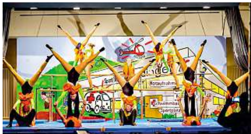
Da war die Welt noch in Ordnung: Die Ehrendinger Turnerinnen an der Turnshow 2018 mit dem Motto «Sportklinik»

Das Leitungsteam und die Vorstände waren gefordert, ihr Trainingsprogramm immer wieder den neuesten Vorschriften anzupassen. Der unregelmässige Turnbetrieb for-