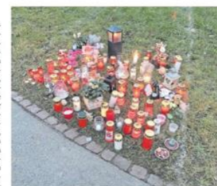
Kerzen am Strassenrand erinnern an den tragischen Unfall, bei dem ein Säugling ums Leben kam. (Dürrenäsch, 26.12.2016)

Bevor der Unfall passierte, waren sie in Aarau beim Coiffeur-der Beschuldigte und seine beiden kleinen Kinder. Vom Teller-Zentrum führen sie dann am späteren Nachmittag des 23. Dezember 2016 via Schafisheim, Seon und Hülwil nach Dürrenäsch. Kurz bevor sie zu Hause ankamen, passierte es. In einer Rechtskurve fuhr der heute 38-jährige geradeaus über das Trottoir. Dort erfasste er eine Mutter, die mit ihren beiden Kindern und dem Hund am Spazieren war. Der Einjährige war im Kinderwagen, der Säugling – nach keinem Monat alt – trug die Mutter vor der Brust. Kinder den Aufprall wurde der Dürrenäscher gemäss Anklageschrift 21,5 Meter durch die Luft geschleudert. Die Mutter prallte auf die Windschutzscheibe und wurde ebenfalls 19 Meter weggeschleudert. Der Säugling löste sich vom Körper der Mutter, weil der Tragegurt riss. Er blieb in ihrer Nähe auf der Wiese liegen. Das wenige Wochen alte Baby starb einen Tag nach dem Unfall. Die Mutter und der Einjährige wurden lebensgefährlich verletzt.