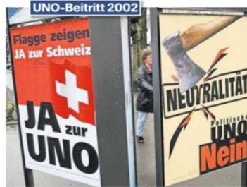
Der Aargau sprach sich mit 51,5 Prozent Nein knapp gegen den UNO-Beitritt aus, gesamtschweizerisch gab es mit 54,6 Prozent hingegen ein Ja.

Otrringen Am Montagmittag sind in Otrringen zwei Autos miteinander kollidiert. Verletzt wurde niemand, laut Kantonspolizei entstand aber Sachschaden in Höhe von mehreren tausend Franken. Weil der Unfallhergang nicht klar ist, sucht die Polizei nun Zeugen. Wer Angaben zu diesem Unfall machen kann, wird gebeten, sich beim Stützpunkt Zofingen unter 062 745 11 11 zu melden. (az)