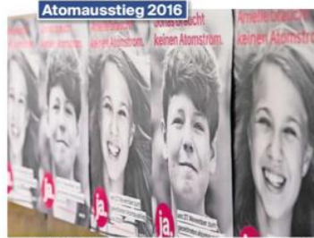
Nur gerade 10,3 Prozent der Stimmenden in Lebbadt, wo das neueste AKW der Schweiz steht, sagten Ja zur Atomausstieg-Initiative.