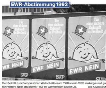
Der Beitritt zum Europäischen Wirtschaftsraum EWR wurde 1992 im Aargau mit gut 60 Prozent Nein abgelehnt – nur elf Gemeinden sagten Ja.

Besonders schwer hatten es SP und Grüne zu Beginn des neuen Jahrtausends. «In der Gesellschaft fand eine konservative Wende statt», sagt Hermann. Nachdem die 90er-Jahre ein Jahrzehnt des Umbruchs waren, sei die Skepsis vor der EU, Zuwanderern und