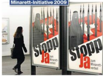
Fast zwei Drittel der Aargauer Stimmberechtigten – exakt waren es 64 Prozent oder 129 000 Personen – unterstützten das Minarettverbot.

dem Islam nach den Anschlägen vom 11. September 2001 gewachsen. Der Kanton Aargau habe sich in dieser Zeit spannend entwickelt. Hermann sagt dazu: «Die konservative Welle war im Aargau besonders stark.» Der Wandel im ländlichen Kanton sei gross gewesen, worauf viele Menschen zunächst abweichend reagierten.