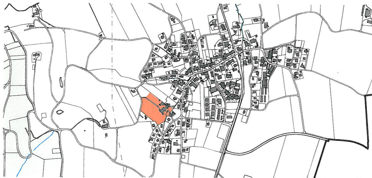
Übersichtsplan 1 : 10'000